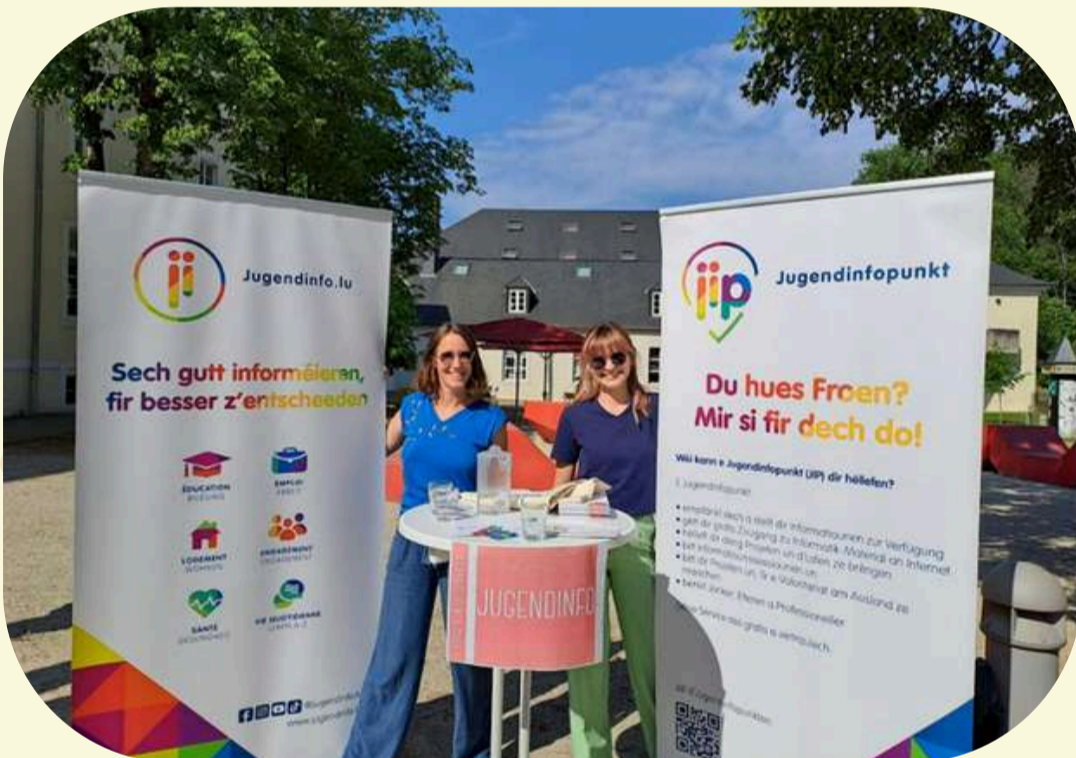
Formation Module A du SNJ

Toujours dans un souci de faire connaître notre domaine de travail, et que le public et les membres du secteur social prennent conscience de la force et de l'unité de notre réseau, nous sommes présents à de nombreux événements tout au long de l'année, avec nos collègues des autres JIPs afin de présenter notre travail (au DZDW, au Modul A du SNJ, Bichermaart goes Jugendmaart, OnStéitsch du SNJ)