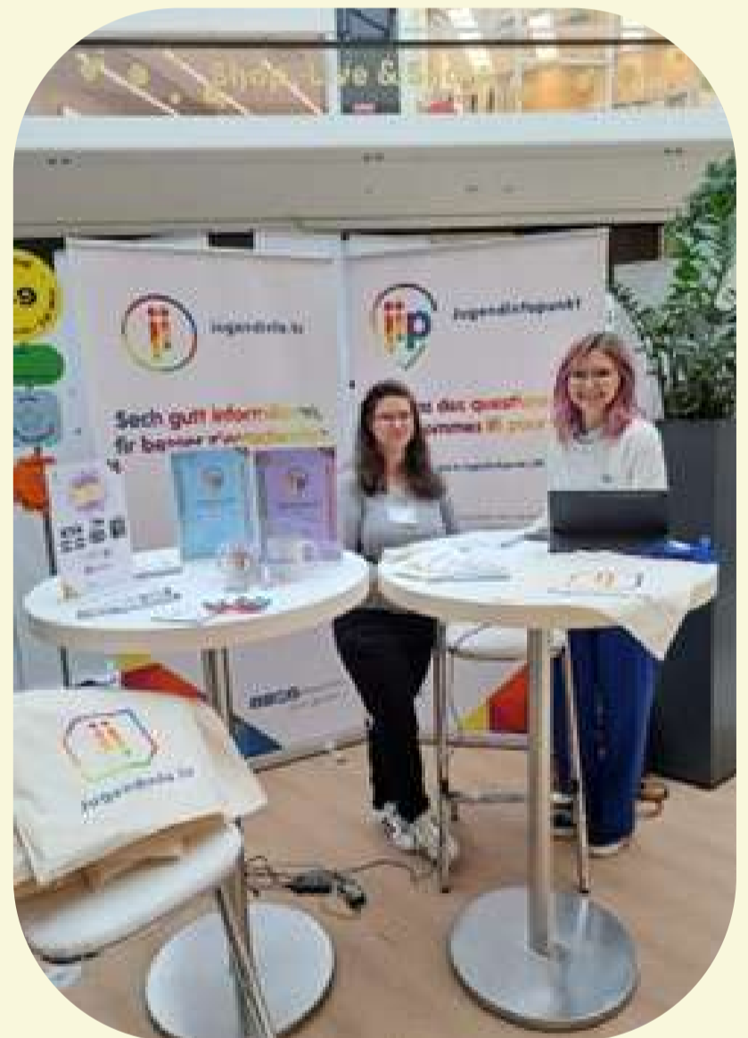
Deng Zukunft Dai Wee